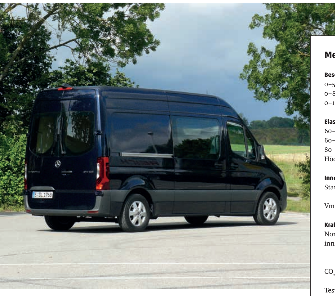
Der lange Radstand mit Frontantrieb ergibt gewöhnungsbedürftige Proportionen und einen großen Wendekreis.